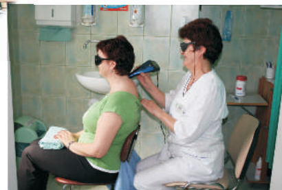
Leczenie przy pomocy lasera