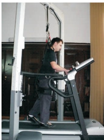
Pacjent podczas ćwiczeń z wykorzystaniem systemu odciążającego Biodex