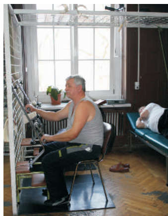
Zajęcia rehabilitacji ruchowej