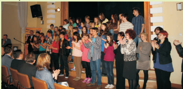
Uczniowie lublińskich szkół oraz ich nauczyciele we wspólnie odegranym przedstawieniu