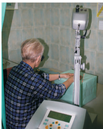
Leczenie przy pomocy lasera

Program kinezyterapii stosowany w gabinecie diagnostyki rehabilitacyjnej. Pacjent podczas badania na platformie PDM-S; badanie to pozwala terapię zmierzyć aspekty związane z obciążeniem statycznym i ustalić właściwy kierunek rehabilitacji, platformę wykorzystuje się również do nauki prawidłowego obciążania stopy oraz kontroli postępów rehabilitacji.