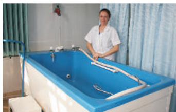
Urządzenia do hydroterapii