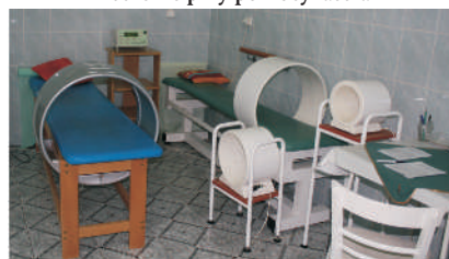
Sprzęt do leczenia polem magnetycznym

Pierwsi pacjenci ze schorzeniami neurologicznymi, kardiologicznymi i narządu ruchu zostali przyjęci tu w marcu 1963 r. Wtedy właśnie rozpoczął swoją działalność Wojewódzki Szpital Specjalistyczny, przemianowany później na Wojewódzki Ośrodek Rehabilitacji.