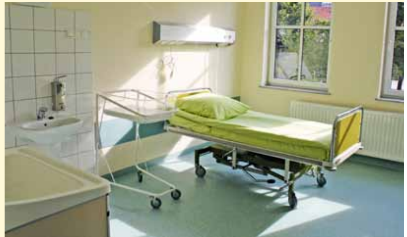
Oddział Dziecięcy. Sala przeznaczona dla chorego dziecka z matką. Dodatkowo sala wyposażona jest w stałą wanienkę do pielęgnacji dziecka.

na Oddziale, wszelkie konieczne interwencje przeprowadzamy pod czujnym okiem matki, rodzice są informowani na bieżąco dogłębnie o stanie zdrowia ich pociechy przez ordynatora oddziału.