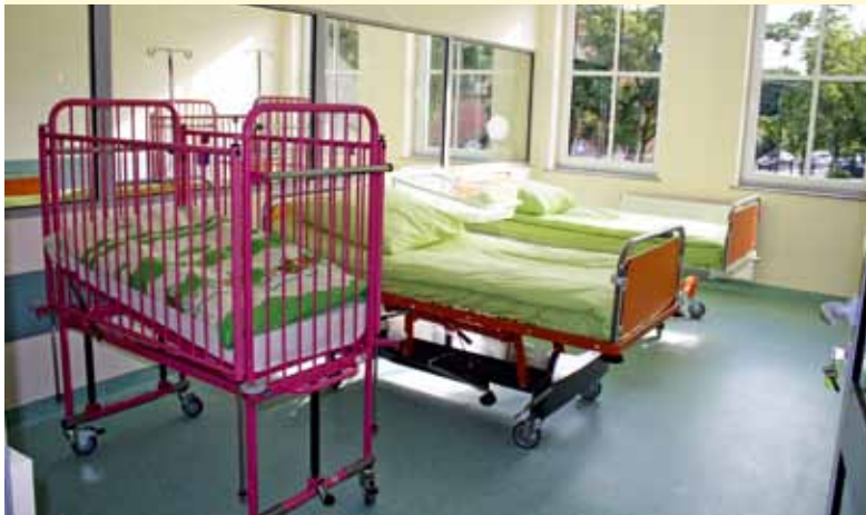
Oddział Dziecięcy. Dwie sale intensywnego bezpośredniego dozoru pielęgniarskiego.

Myjnia chirurgiczna dla lekarzy przed salą operacyjną. Wyposażona jest w nierdzewne urządzenie zlewowe wraz z dezynfektorami. Drzwi do sali operacyjnej wykonane są z blachy nierdzewnej, kwasoodpornej i otwierane są w systemie bezdotykowym na fotokomórkę.