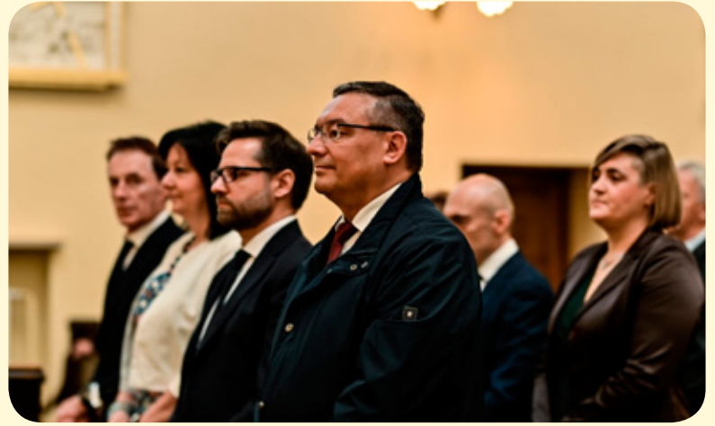
Msza św. w kościele pw. św. Stanisława Kostki w Lublińcu