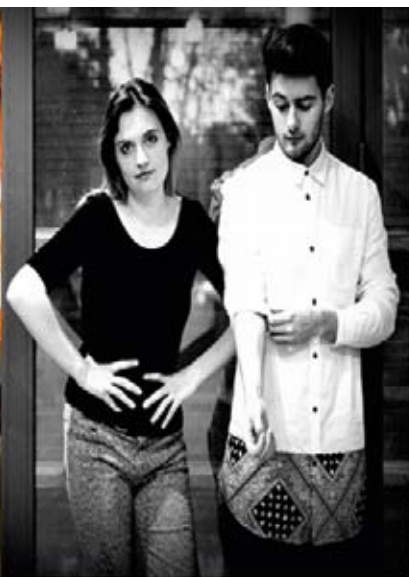
Duet Skiba The Voice of Poland