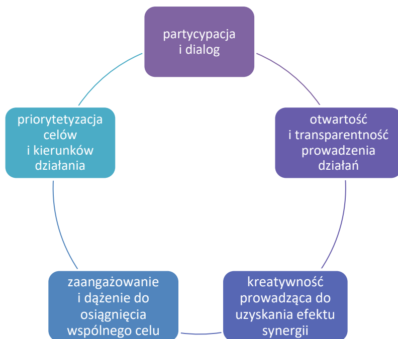
Rysunek 2 Zasady i wartości, na których opiera się proces wdrażania Programu Rozwoju Powiatu Lublinieckiego do roku 2030.

elementem współdziałania, będzie prowadzenie szerokiego dialogu społecznego i umożliwianie poszczególnym zainteresowanym podmiotom możliwości szerokiej partycypacji. Zaangażowanie mieszkańców, podmiotów społecznych i przedsiębiorców, powinno zaowocować wypracowaniem modelu współpracy, w którym partycypacja społeczna wytwarza warunki do współzarządzania powiatem lublinieckim przez mieszkańców. Wdrażanie Programu Rozwoju Powiatu Lublinieckiego będzie odbywało się w zgodzie z obowiązującymi zasadami i przepisami, jak również uwzględniając poniższe wartości i zasady: