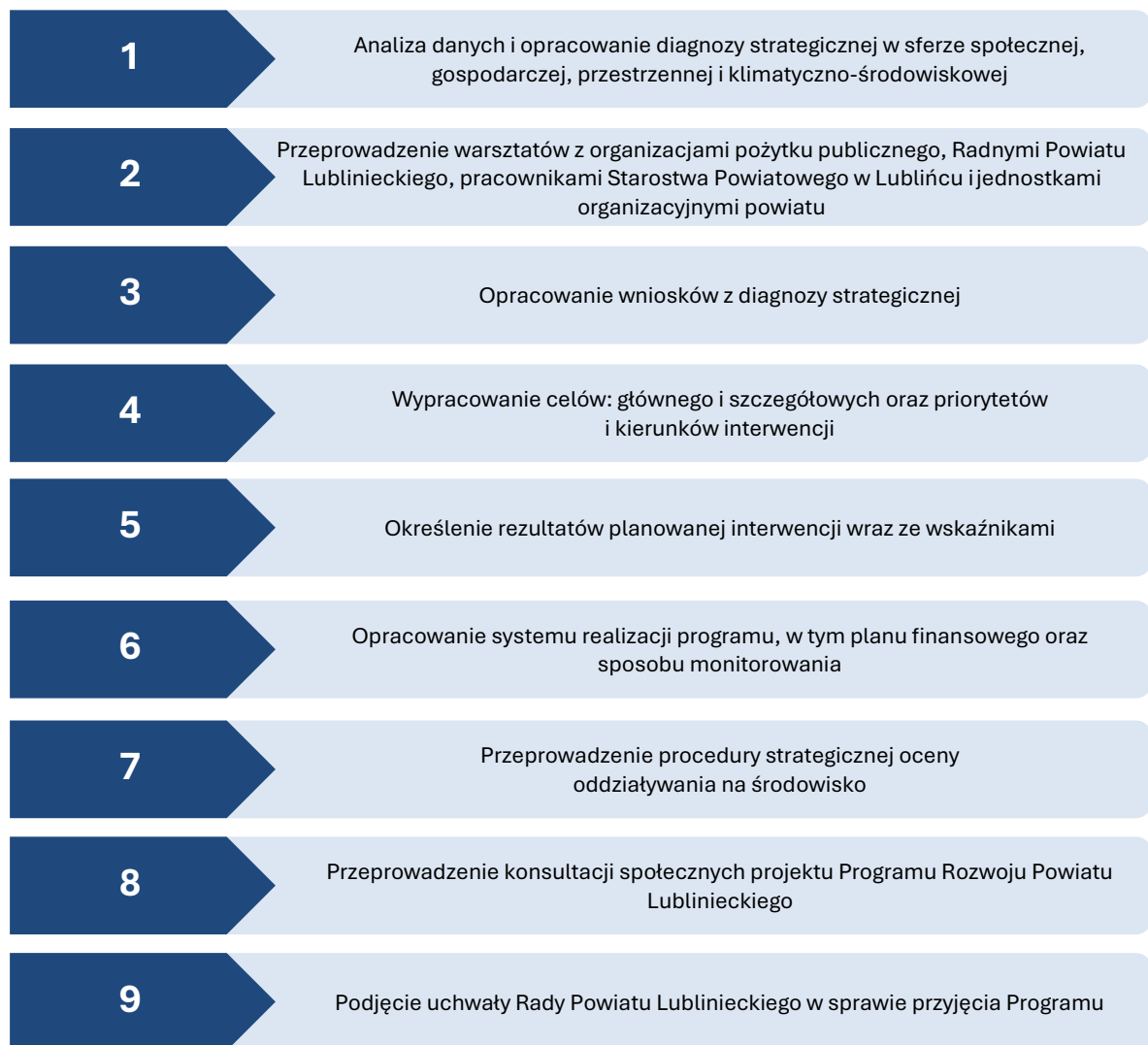
Rysunek 1 Etapy opracowania Programu Rozwoju Powiatu Lublinieckiego do roku 2030.